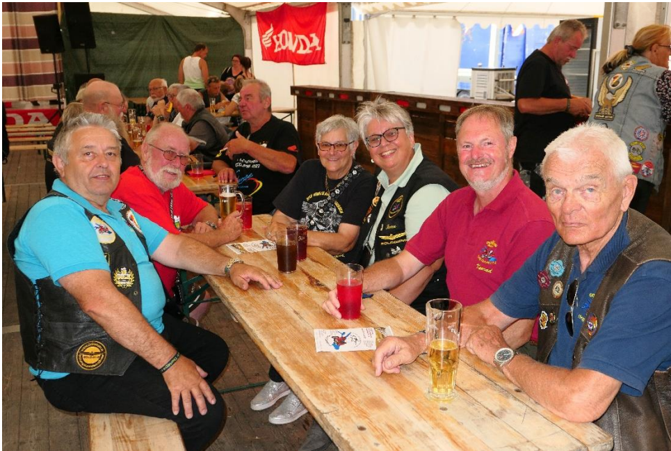
Am Samstagabend zur Preisverleihung im Zelt