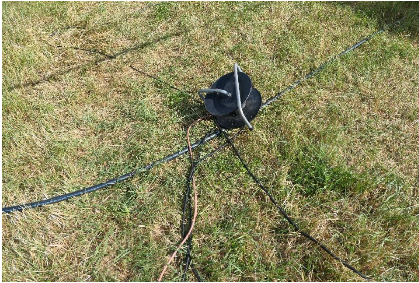
Stromversorgung für Wohnmobile in Daasdorf