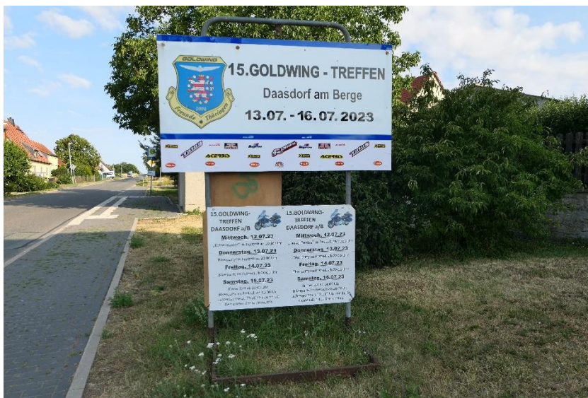
Morgendlicher Spaziergang Damit Kopfweh besser wird.