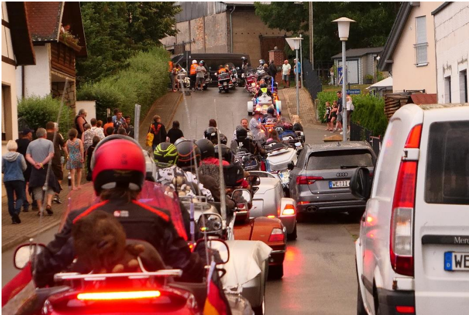
Aufstellung zur Lichterfahrt

Kurz vor der legendären Lichterfahrt durch die Ortschaften um Daasdorf kam noch ein Regenschauer.