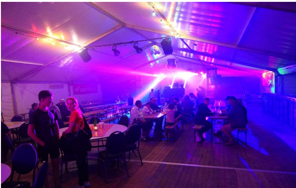
An allen 3 Abenden gab es nur Disco, wobei es im Zelt zu laut zum reden war und deshalb die meisten draußen waren.