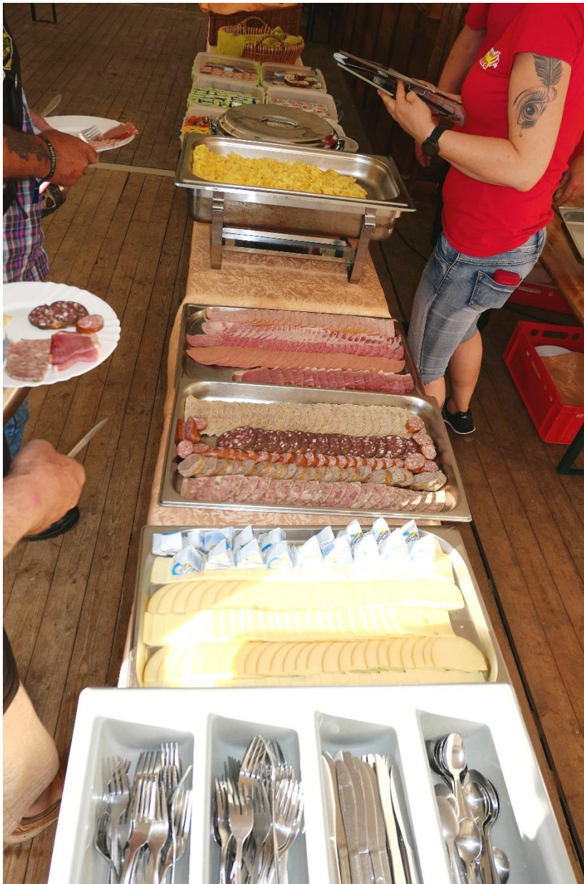
Frühstücksbuffet Im Vorverkauf 8,50 € sonst 9 € Es war alles da was man zum Frühstücken braucht, sogar Rührei und Müsli mit Yoghurt