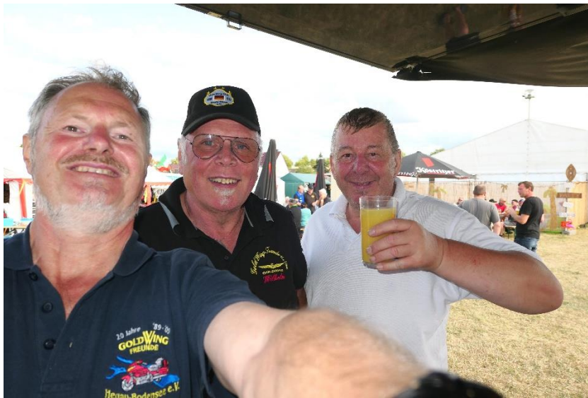
Bierchen trinken mit Freunden