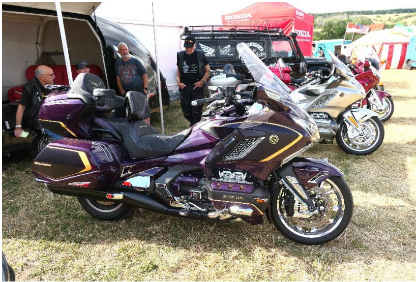
Neue Goldwing von Carlo der beim Fuchs arbeitet. Wert ca. 70000 €